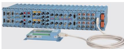
プラグインモジュール（全23種類） 本体に最大8枚のプラグインモジュールを 実装できます。