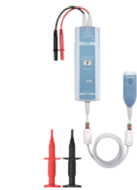
高電圧差動プローブ 702921/702922 (別売)

DLM3000HDシリーズは、12ビットの垂直軸分解能に対応したオシロスコープです。