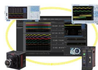
統合計測ソフトウェアプラットフォーム IS8000（別売）

DL950は、インバータや電源などのフローティング電圧計測のほか、温度や振動などの各種センサーを直接接続でき、計測対象に応じて組み換え可能なプラグインモジュールを用意しました。