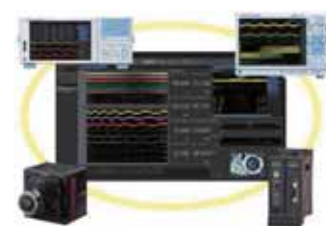
統合計測ソフトウェアプラットフォーム IS8000（別売）

DL950は、インバータや電源などのフローティング電圧計測のほか、温度や振動などの各種センサーを直接接続でき、計測対象に応じて組み換え可能なプラグインモジュールを用意しました。