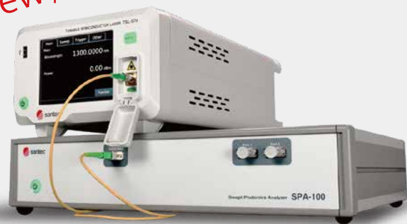
波長掃引型 フォトリソグラフィアナライザ