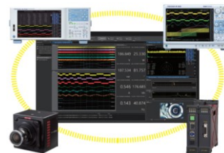
統合計測ソフトウェアプラットフォーム IS8000 (別売)

DL950は、インバータや電源などのフローティング電圧計測のほか、温度や振動などの各種センサーを直接接続でき、計測対象に応じて組み換え可能なプラグインモジュールを用意しました。