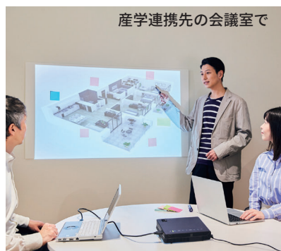
産学連携先の会議室で