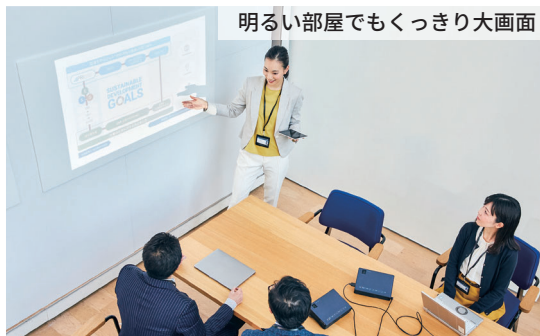
明るい部屋でもくっきり大画面