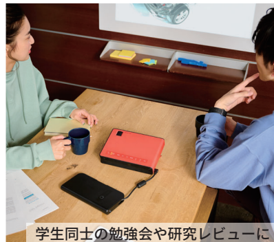
学生同士の勉強会や研究レビューに