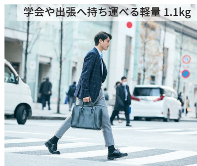
学会や出張へ持ち運べる軽量 1.1kg