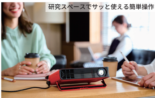
研究スペースでサッと使える簡単操作