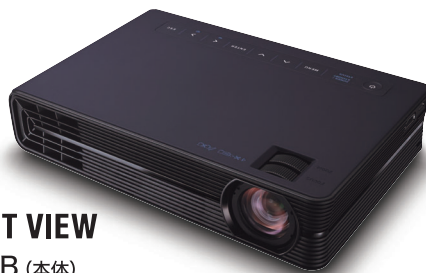
FORESIGHT VIEW ・CX-F1-NB (本体)