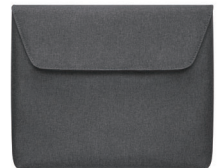
・YB-3 (ソフトインナーケース)