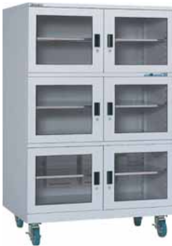
SDD-1206D1 容量 1189ℓ 最低到達湿度 0%RH 露点温度 -55℃ (20℃・50%RH時)