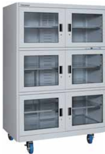
SDM-1206M1 容量 1190ℓ 最低到達湿度 0~1%RH 加温 (Max50℃)