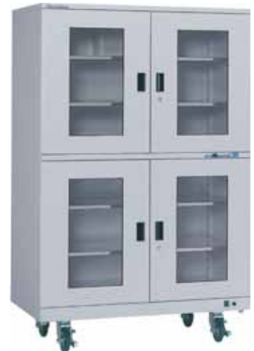
SDH-1204H1 容量 1197ℓ 最低到達湿度 0~1%RH 空気清浄度 ISO クラス 5

スーパードライは 150 ~ 1700ℓクラスまで幅広いサイズがあり、用途に合わせた特注にも対応しております。お気軽にお問い合わせください。