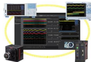
統合計測ソフトウェアプラットフォーム IS8000 (別売)

DL950は、インバータや電源などのフローティング電圧計測のほか、温度や振動などの各種センサーを直接接続でき、計測対象に応じて組み換え可能なプラグインモジュールを用意しました。