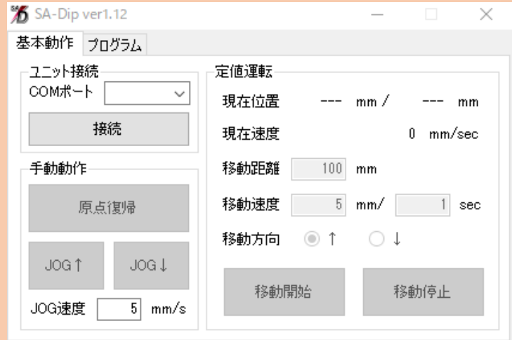
かんたんPC操作画面