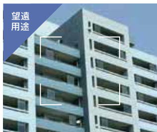
遠距離でも正確な外壁診断を!