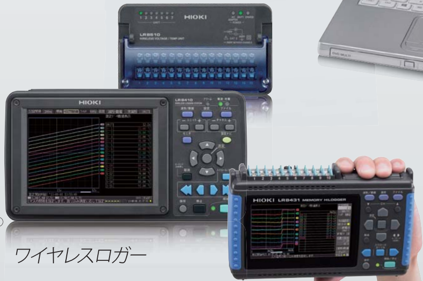
⑤ ワイヤレスロガー