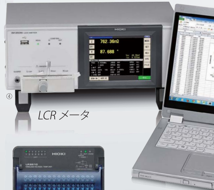
④ LCR メータ