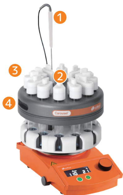
Carousel 12 Plus