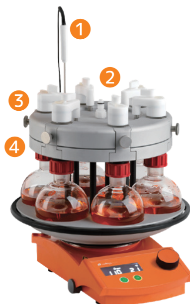
Carousel 6 Plus