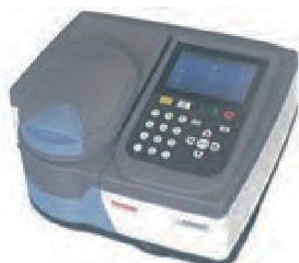
Thermo Scientific™ GENESYS™ 30 可視分光光度計