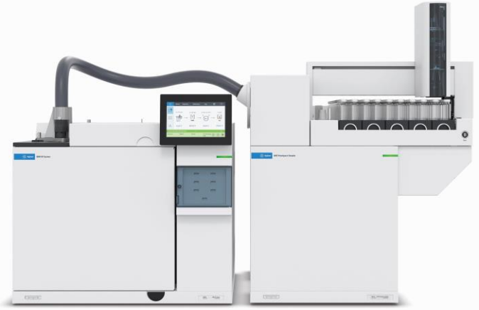
8890 GC と 8697-XLトレイ (120検体)