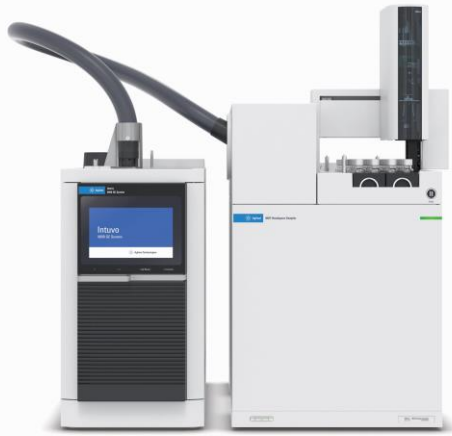
Intuvo 9000 GC と 8697 (48検体)

8697 ヘッドスペースサンプリャは Agilent 8890、8860、および Intuvo 9000 GC と直接通信するため、流路の状態を完全に把握できます。タッチスクリーンとブラウザインターフェイスでこの情報を集約することにより、診断、トラブルシューティング、エラー検出を支援します。