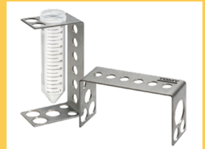
超音波チューブスタンド STS-01