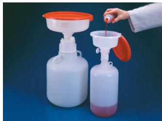
Thermo Scientific™ Nalgene™ 安全廃液システム