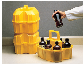
Thermo Scientific™ Nalgene™ セーフティボトルキャリアー