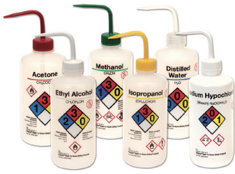
Thermo Scientific™ Nalgene™ 薬品識別洗浄瓶