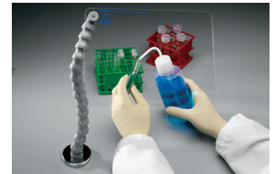
Thermo Scientific™ Nalgene™ 液体飛散防止シールド

詳細はこちらをご覧ください thermofisher.com/jp-labsafety