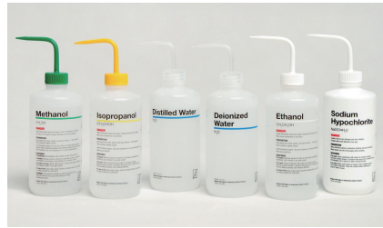
Thermo Scientific™ Nalgene™ 薬品識別洗浄瓶 (GHS準拠表示)