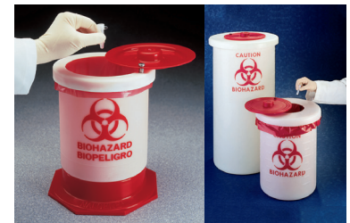
Thermo Scientific™ Nalgene™ バイオハザードコンテナ