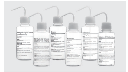
Thermo Scientific™ Nalgene™ 薬品識別洗浄瓶 (GHS準拠表示)