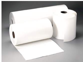
Thermo Scientific™ Nalgene™ CleanSheets™ ベンチガード