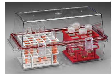
Thermo Scientific™ Nalgene™ バイオトランスポートキャリアー