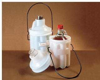
Thermo Scientific™ Nalgene™ セーフティボトルキャリアー