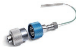
InfinityLab クイックチェンジ インラインフィルタ