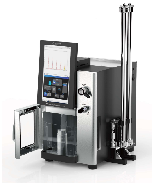
LaboACE LC-5060 Plus II