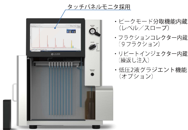
タッチパネルモニタ採用

サンプル注入／不要ピークのカット／リサイクル／分取などの作業（イベント）をプログラム化。同一試料の大量分取効率が飛躍的に向上します!