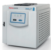
Thermo Scientific™ TRACE™ 1600 ガスクロマトグラフ