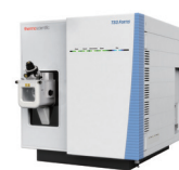
Thermo Scientific™ TSQ Fortis Plus トリプル四重極質量分析計