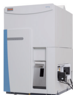
Thermo Scientific™ iCAP™ RQ/TQ/TQs ICP-MS