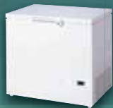
チェストフリーザー (D/NF シリーズ)