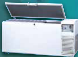
CLNシリーズ(ダブル冷却システム)