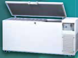
CLNシリーズ(ダブル冷却システム)