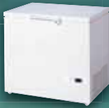
チェストフリーザー (D/NF シリーズ)