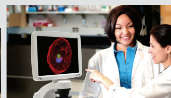
画面を見ながらディスカッション

デモ、営業訪問のお申し込みはこちらから thermofisher.com/evosquote