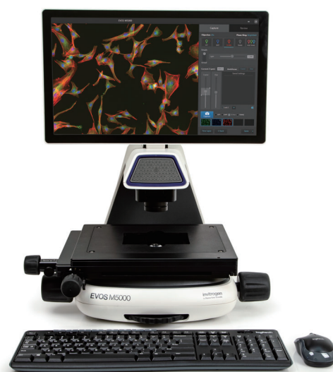
EVOS M5000 Imaging System

高画質のマルチカラー蛍光画像を取得でき、多彩な LED ライトキューブにより、 透過光でのカラー画像の取得も可能です。