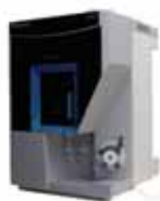
Thermo Scientific™ iCAP™ PRO シリーズ ICP-OES