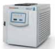
Thermo Scientific™ TRACE™ 1600 ガスクロマトグラフ