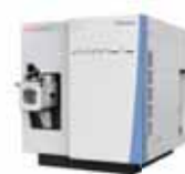
Thermo Scientific™ TSQ Fortis Plus トリプル四重極質量分析計