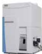
Thermo Scientific™ iCAP™ RQ/TQ/TQs ICP-MS