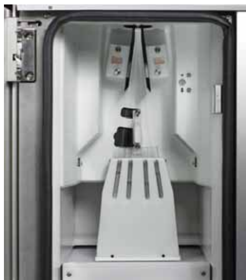
4方向ソーティング