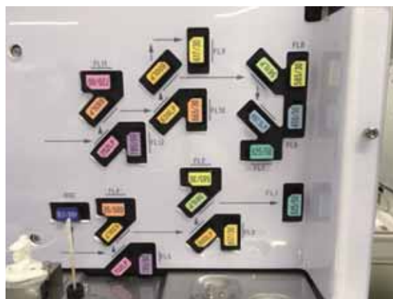
蛍光検出器と光学フィルター