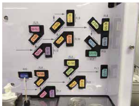
蛍光検出器と光学フィルター