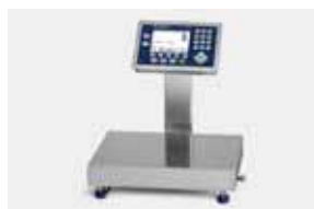
工業用スケールとロードセルシステム