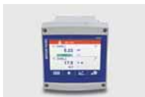
プロセス制御機器