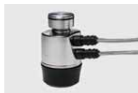
輸送とロジスティクス

オンラインセミナーでは、作業者による計量・計測のバラつき、安全性の確保、歩留まりなどにお困りの方向けに作業時間の短縮、エラー削減、生産性向上を実現するノウハウを紹介！