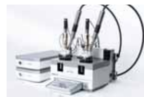
自動合成装置とIn Situ 分析