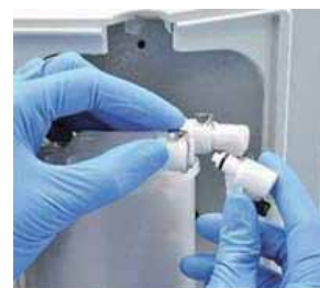
Aquastopクイックコネクト設計