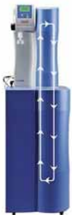
LabTower T II