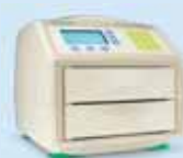
トランスプロットTurbo

高速転写装置トランスプロットTurboやTGXゲル専用泳動槽を組み合わせたお得なパッケージもご用意しています。