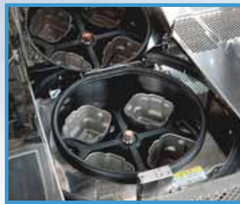
遠心分離モジュール