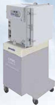
細胞培養モジュール