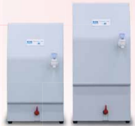
10L 20L ※60L、100Lは色合いが異なります。(濃グレー系)