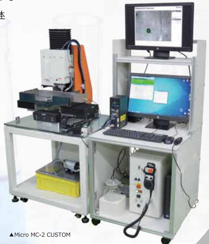
▲Micro MC-2 CUSTOM