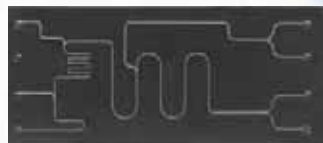
▲マイクロリアクター細溝加工 材質：耐熱ガラス 0.1mm 幅溝