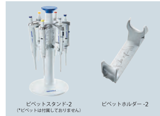
ピペットスタンド-2 (*ピペットは付属していません)